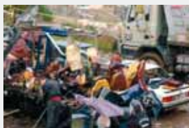
Айн-Аля, Ливан, 13 февраля 2007 г. Взрыв в христианском квартале

Лишенные поддержки иностранных государств и их спецслужб, террористы не смогут продолжать свою деятельность в прежнем объеме.