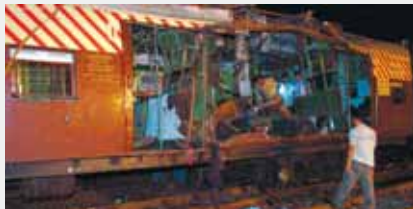
Мумбаи, Индия, 11 июля 2006 г.

Политическая организация, взявшая на вооружение террористические методы борьбы, со временем перерождается в преступную группировку, прикрывающуюся политическими лозунгами.