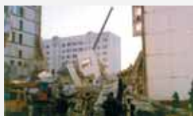
Каспийск, 16 ноября 1996 г.