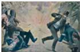
Анише, Франция. 1895 г. Терракт анархиста

В XXI в. просматривается тенденция к расширению масштабов и географии террористической деятельности. Увеличивается число террористических актов, совершаемых с целью личного обогащения. Растет число террористических актов на почве политического противоборства различных сил, а также на почве межэтнических и межконфессиональных противоречий.