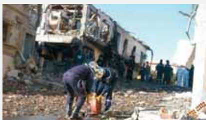
Тения, Алжир, 29 января 2008 г.

Националистический терроризм органически связан с сепаратизмом, направленным на изменение существующего государственного устройства, правового статуса национально-государственных или административно-территориальных образований, нарушение территориального единства страны, выход тех или иных территориальных единиц из состава государства, образование собственного независимого государства. Осуществляется организациями этносепаратистской направленности с целью ликвидации экономического и политического диктата инонациональных государств (например, «Ирландская республиканская армия» (Северная Ирландия), «Рабочая партия Курдистана» (Турция), «Батасуна», «ЭТА» (Испания), «Фронт национального освобождения Корсика» (Франция), «Фронт освобождения Квебека» (Канада), «Вооруженные силы национального освобождения» (Пуэрто-Рико, США), «Тигры освобождения Тамил Илама» (Шри-Ланка), «УНИТА» (Ангола) и др.).