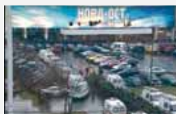
Москва, Дубровка, 25 октября 2002 г.