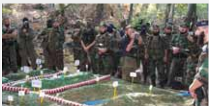
Чеченская Республика, 6 сентября 2002 г.

Субъектами политического терроризма, как правило, выступают радикальные политические партии, отдельные группировки внутри партий или общественных объединений, экстремистские организации, отрицающие легальные формы политической борьбы и делающие ставку на силовое давление (например, «Красные бригады» (Италия), «Франция красной армии» (Германия), «Аксон директ» (Франция), «Японская красная армия» (Япония), «эскадроны смерти» в Латинской Америке и др.).