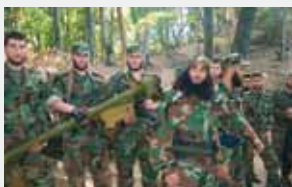
Чеченская Республика, 9 июня 2002 г. Представитель «Аль-Каиды» Абу аль-Валид – уничтожен