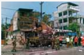
Коломбо, Шри-Ланка, 23 февраля 2008 г.