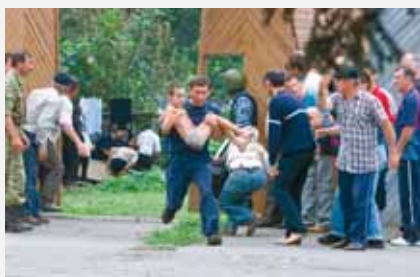
Беслан, сентябрь 2004 г.

Никто, к сожалению, не защищен от ситуации, когда может оказаться в заложниках у террористов