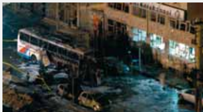
Диябакир, Турция, 1 марта 2008 г.

Кибертерроризм представляет серьезную угрозу для человечества, сравнимую с ядерным, бактериологическим и химическим оружием, причем степень этой угрозы в силу своей новизны до конца еще не осознана и не изучена.