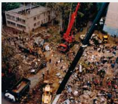
Москва, Каширское шоссе, 13 сентября 1999 г.

Департамент по борьбе с организованной преступностью и терроризмом МВД России (495) 604-88-15