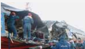
Ессентуки, 5 декабря 2003 г.