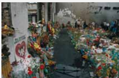
Беслан, сентябрь 2004 г.