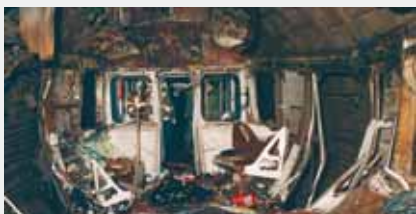
Москва, метро «Автозаводская», 6 февраля 2004 г.

Примеры: «Аль-Каида», движение «Талибан» (Афганистан), «Братья-мусульмане» (Египет), «Абу-Сайяф» (Филиппины), «Ансар аль-Ислам» (Ирак), «Асбат аль-Ансар», «Хизб ут-Тахрир аль-Ислами» (Ливан), «Аум Синрикё» (Япония) и другие.