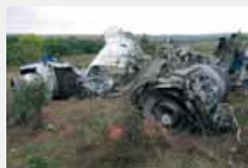
Ростовская область, 24 августа 2004 г. Теракт на борту Ту-154 – место падения

Российская Федерация активно поддерживает усилия мирового сообщества по борьбе с международным терроризмом