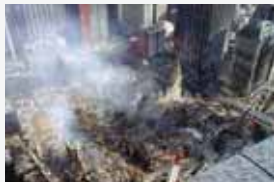
Нью-Йорк, США, 11 сентября 2001 г.

Терроризм по своим масштабам, непредсказуемости и последствиям превратился в одну из наиболее опасных общественно-политических и моральных проблем, с которыми человечество вошло в XXI столетие